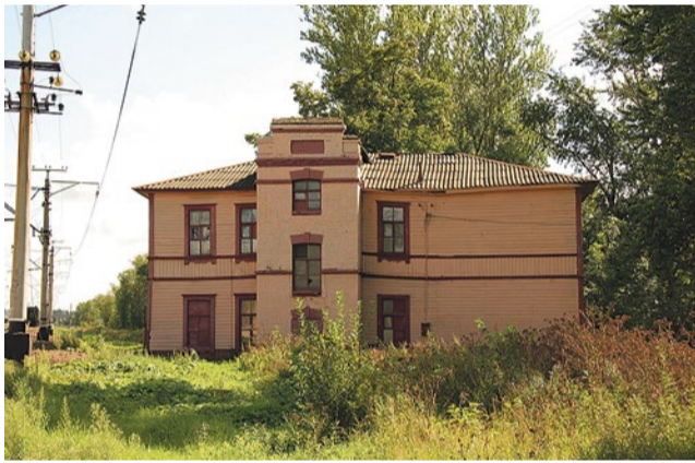
Школа рабочей молодежи, сгорела в марте 2015 года