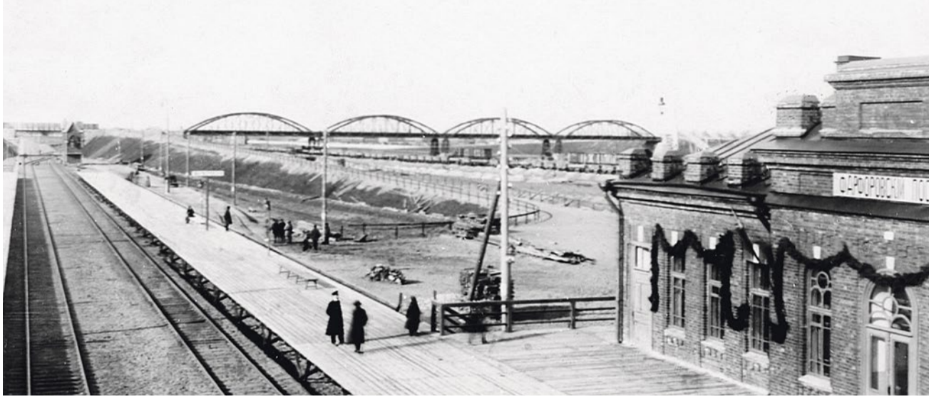
Станция Фарфоровский Пост. Вокзал и путепровод.