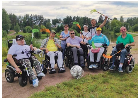
Команда спортклуба «Паралимпик»

«Наша тренировка начинается с подъезда родного дома – нужно организовать, кто тебя завезет, вывезет. Мы привязаны к помощи! Но будет день и будет доступность, все зависит от человека, от его желаний и потребностей».