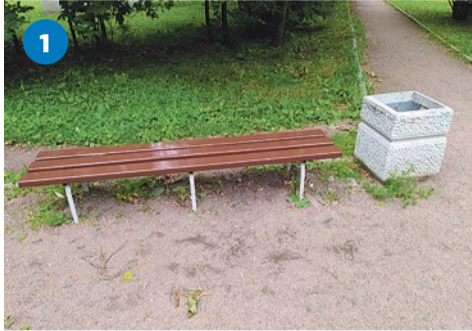
Скамейка после ремонта

Новые газоны, отремонтированные скамейки и чистые скверы – в июле на территории муниципалитета продолжились работы по благоустройству. Сотрудники муниципалитета не только проконтролировали ход работ, но и провели беседы с жителями, которые выгуливают своих питомцев на придомовой территории.