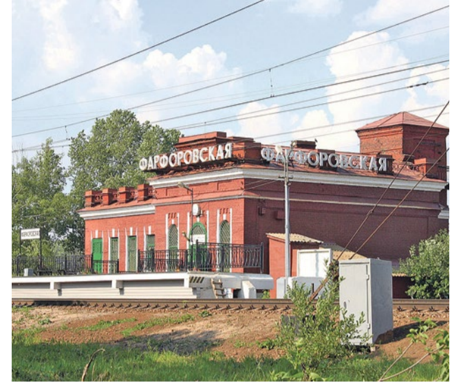
Здание вокзала постройки 1911 года