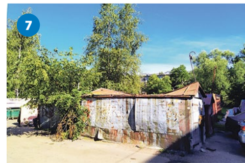
Гаражи, готовящиеся к сносу