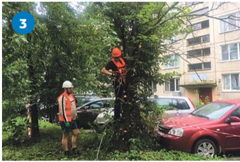
Санитарная рубка деревьев