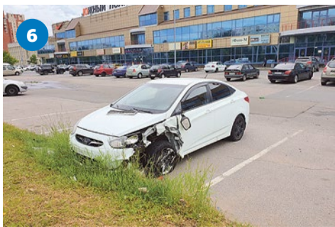
Рейд по выявлению автохлама

Отдохнуть после долгой ходьбы, почитать книгу или просто погреться под лучами летнего солнца теперь можно на обновленных скамейках. Весь июль специалисты занимались их ремонтом: меняли сгнившие доски, красили их заново. Всего удалось привести в порядок 60 скамеек (фото 1) и отремонтировать качели на улице Турку, 22/5. Любители отдохнуть на свежем воздухе уже успели оценить такое преобразование. В августе будут отремонтированы еще 30 скамеек и 4 песочницы.