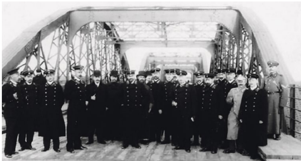
Группа служащих Министерства путей сообщения у стальных конструкций моста на станции Фарфоровский пост. начало XX века.

В 2010 году Фарфоровский путепровод отметил вековой юбилей. За эти годы поток транспорта увеличился многократно, а пропускная способность не изменялась. За сто лет металлические конструкции, конечно же, подверглись коррозии. Нельзя не признать безмерный запас прочности, который был вло-