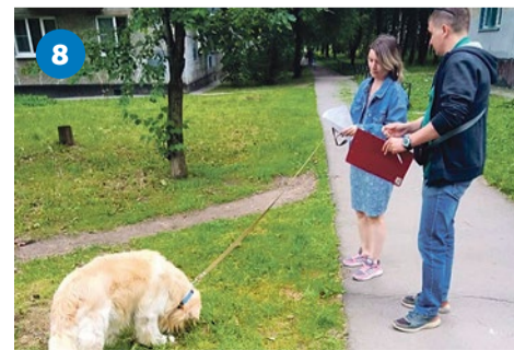
Беседы с собаководами