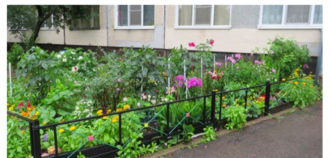
Улица Турку, 22/1