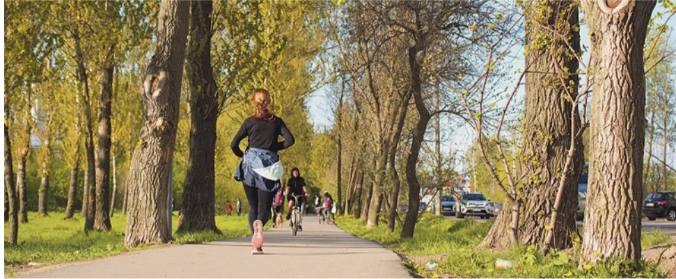
Живописная аллея может пойти под снос

Транспортные эксперты считают, что создание тротуаров, освещения, пешеходных переходов и асфальтированных