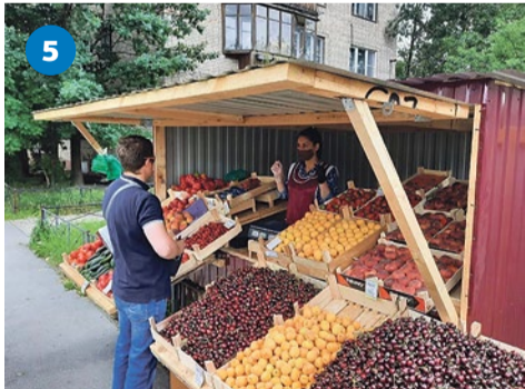
Рейд по незаконной торговле