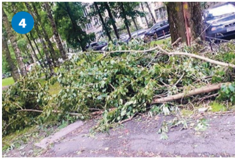
Ликвидация последствий урагана