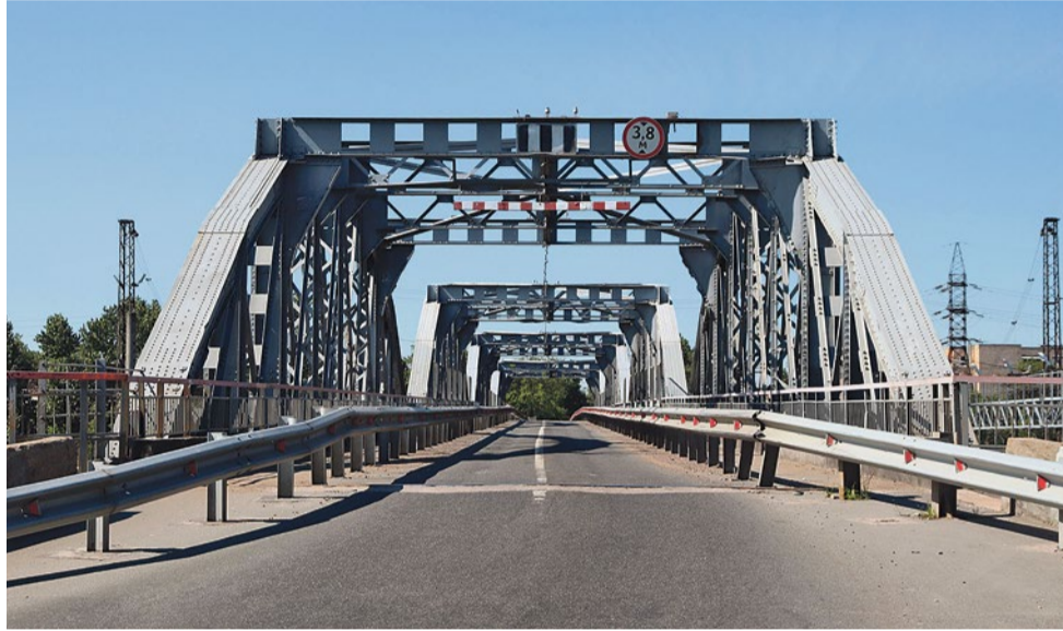
Фарфоровский путепровод после реконструкции, 2020 год.

Изначально арочные пролеты Фарфоровского путепровода имели деревянное дорожное покрытие с двумя тротуарами в объеме моста. В таком состоянии путепровод просуществовал вплоть до середины 1960-х годов. Это поразительно, но при своей ощутимой длине путепровод без каких-либо серьезных повреждений пережил Великую Отечественную. И это несмотря на то, что в непосредственной близости от