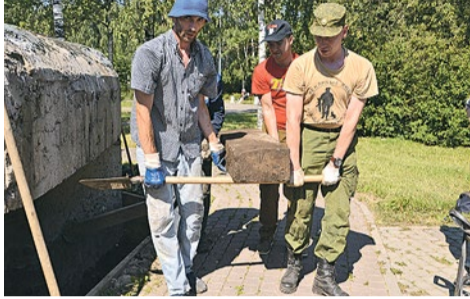
Расчистка входа и каземата дота № 20 на Пражской улице, 35.

Жители Купчина вместе с сотрудниками муниципалитета и членами Клуба истории и фортификации расчистили дот на Пражской улице.